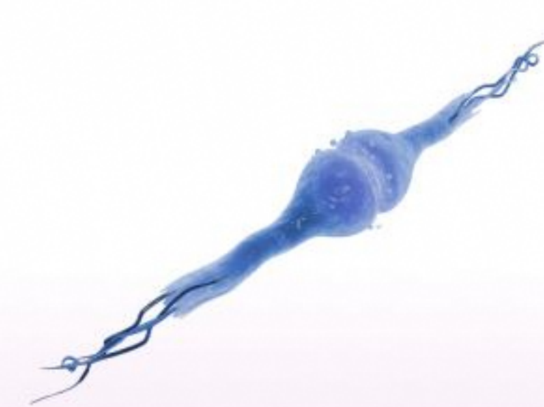
Апоптоз холиновых нейронов 4