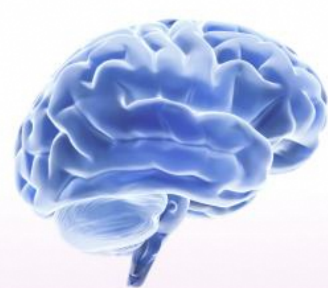
Снижение нейропластичности 4