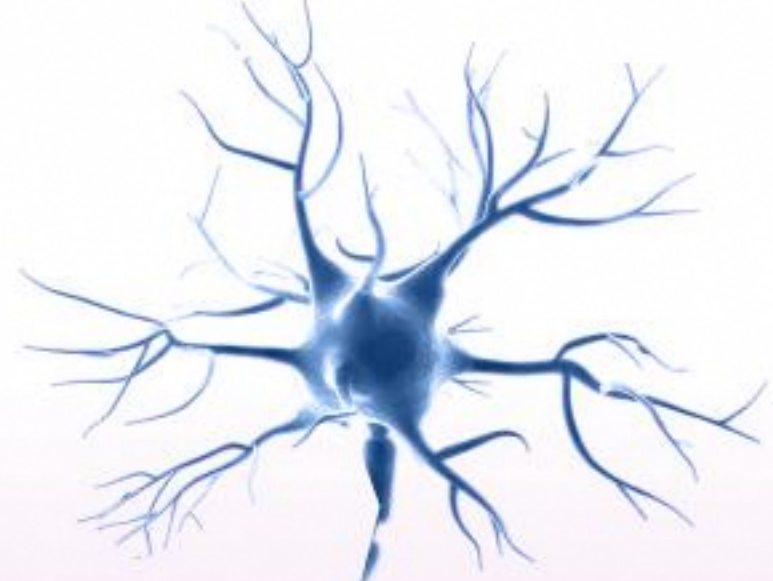
Воспаление нейронов 4